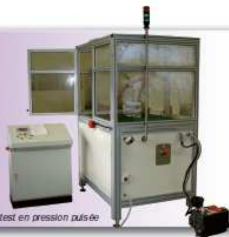
Banc de test en pression pulsée