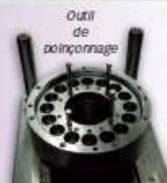
Outil de poinçonnage