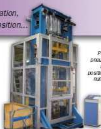
Presse pneumatique avec positionnement numérique